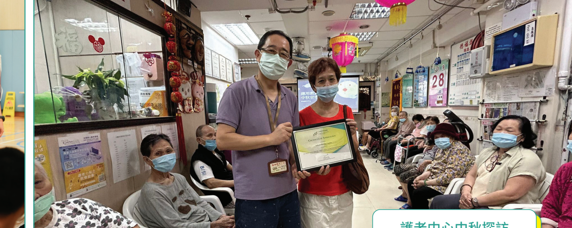
護老中心中秋探訪