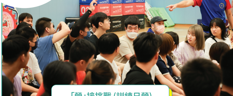
「營」接挑戰 (訓練日營)